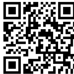
ホームページQRコード

本年度も、皆様方のご協力のもと、精一杯活動していきたいと思っております。大勢の皆様のご来館、ご利用を心よりお待ちしております。