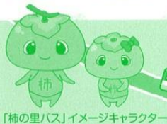
「柿の里バス」イメージキャラクター