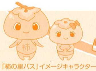
「柿の里バス」イメージキャラクター